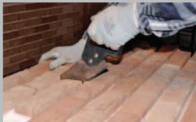
17 Completare il taglio del pannello con seghetto o taglierina a filo.