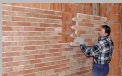
20 Ripetere la procedura fino a completamento della parete, seguendo sempre l'ordine dal basso verso l'alto.