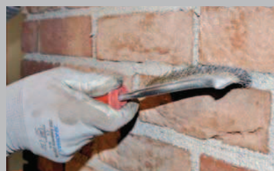
24 Completare la finitura con spazzola.