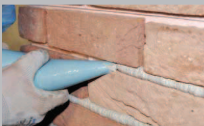
22 Eseguire la fugatura di tutta la parete.