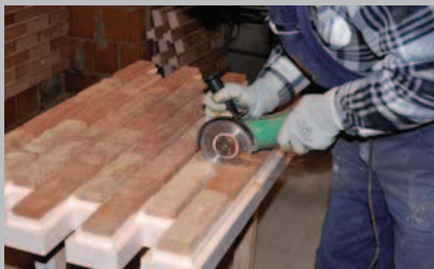
16 Tagliare prima i listelli del pannello con un flessibile.

NOTA 4: per un lavoro a regola d'arte il materiale deve essere ordinato tutto insieme in modo da non avere pannelli di colore diverso.