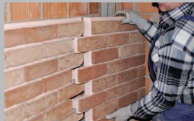
18 Appoggiare il pannello tagliato.