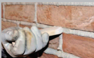
23 Stendere e schiacciare lo stucco.