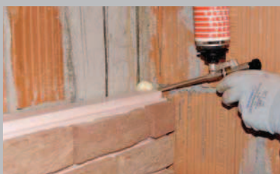
19 Applicare la colla ISOVISTA® tra pannello tagliato e parete in modo da eliminare il ponte termico.