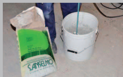
21 Preparare lo stucco per la finitura.